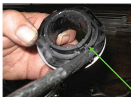
Použijte malé množství tuku