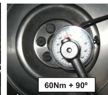
60Nm + 90°